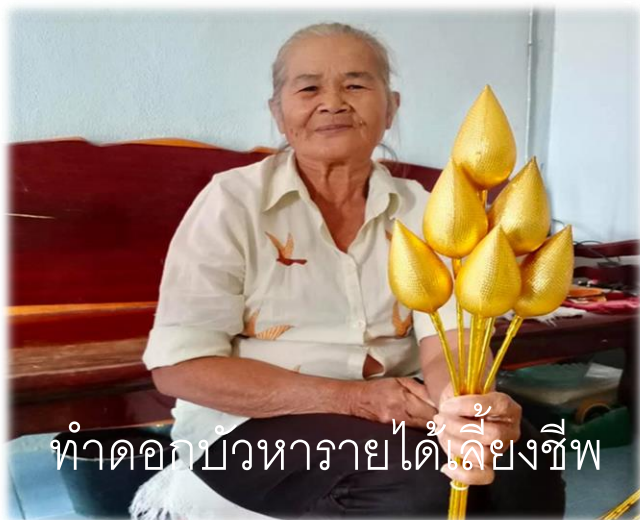
ทำดอกบัวหารายได้เลี้ยงชีพ