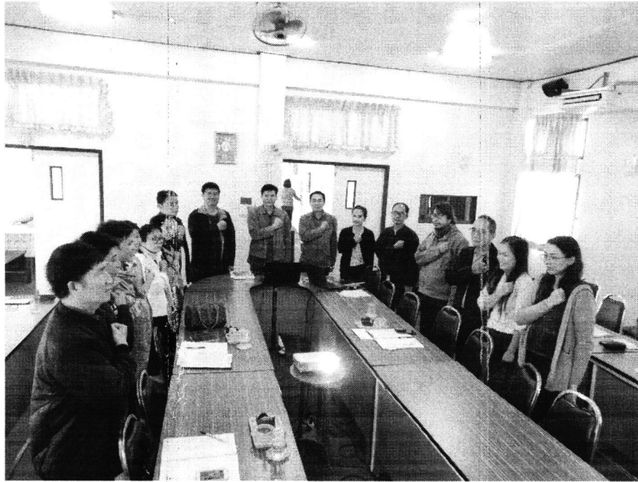
ภาพถ่ายประกอบการประกาศเจตจำนงสุจริต