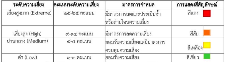
ตารางระดับของความเสี่ยง (Degree of Risk)

ซึ่งจัดแบ่งเป็น ๔ ระดับสามารถแสดงเป็น Risk Profile แบ่งพื้นที่เป็น ๔ ส่วน (๔ Quadrant) ใช้เกณฑ์ในการจัดแบ่งดังนี้