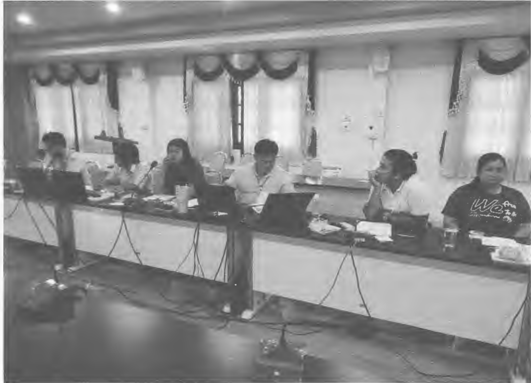
ภาพการประชุมคณะกรรมการควบคุมภายใน ณ ห้องประชุมสำนักงานสาธารณสุขอำเภอท่าตะเกียบ วันที่ ๒๙ มกราคม ๒๕๖๒