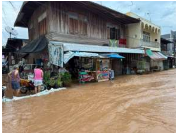
พื้นที่ได้รับภัยพิบัติ จะได้รับการลดหย่อนภาษี

๒. ลดหรือยกเว้นภาษีในกรณีที่ดินหรือสิ่งปลูกสร้างได้รับความเสียหายมาก หรือถูกทำลายให้เสื่อมสภาพด้วยเหตุอันพ้นวิสัยที่จะป้องกันได้โดยทั่วไป โดยมีแนวทาง ดังนี้