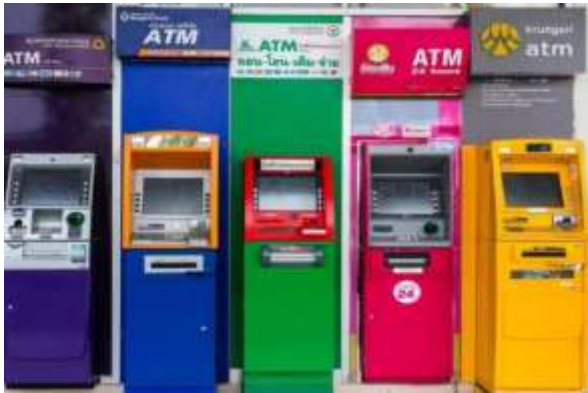
ตู้ฝากถอนเงินสด

ตัวอย่างสิ่งปลูกสร้างที่อยู่ในข่ายได้รับการยกเว้นภาษี