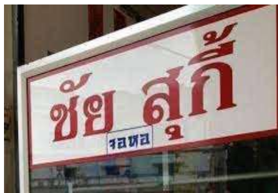
ตัวอย่างป้ายที่ต้องเสียภาษี

หากในกรณีที่ไม่มีผู้มายื่นแบบแสดงรายการภาษีป้าย หรือเจ้าหน้าที่ไม่สามารถ ติดต่อหรือหาตัวเจ้าของป้ายได้ให้ถือว่าผู้ครอบครองป้ายมีหน้าที่เสียภาษีป้าย แต่ถ้า หาตัวผู้ครอบครองป้ายไม่ได้เจ้าของหรือผู้ครอบครองที่ดินที่ติดตั้งป้ายจะต้องเป็น ผู้เสียภาษีป้ายแทน ตามลำดับที่กล่าวมา