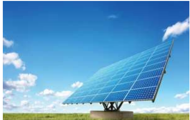
แผงโซลาเซลล์