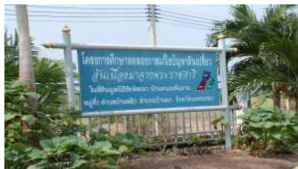
ตัวอย่างป้ายที่ไม่ต้องเสียภาษี