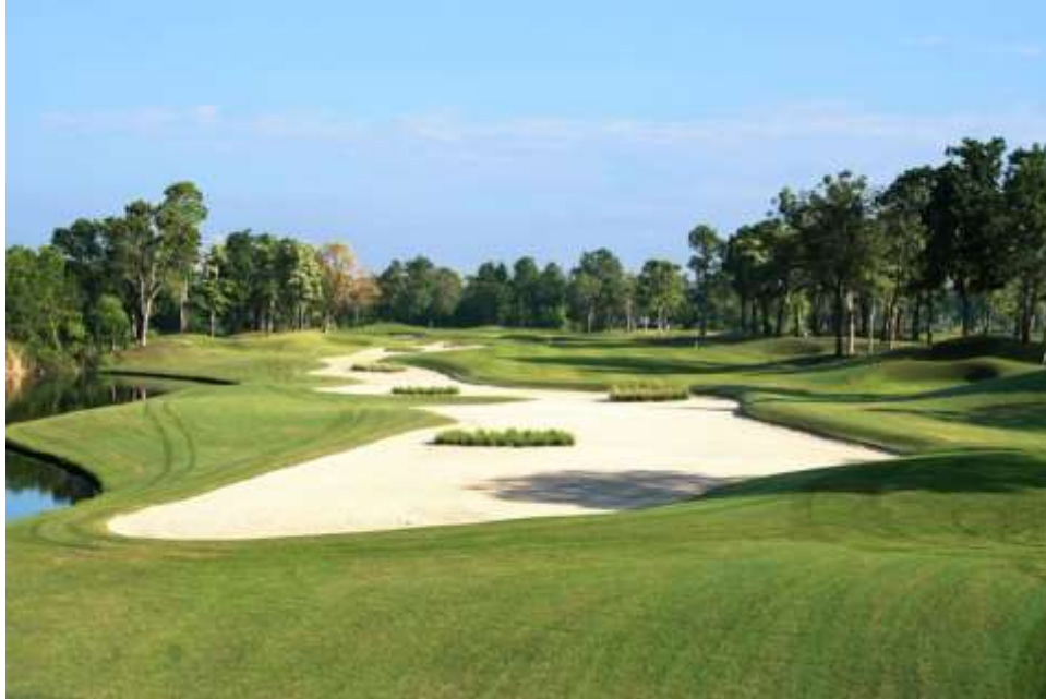
สนามกอล์ฟ จัดเป็นธุรกิจการกีฬา จึงได้รับการลดภาษี

๑.๔ ลดภาษีร้อยละ ๙๐ ของจำนวนภาษีที่จะต้องเสียของทรัพย์สินที่ ใช้เป็นสถานที่เล่นกีฬา สวนสัตว์สวนสนุก หรือที่จอดรถสาธารณะ