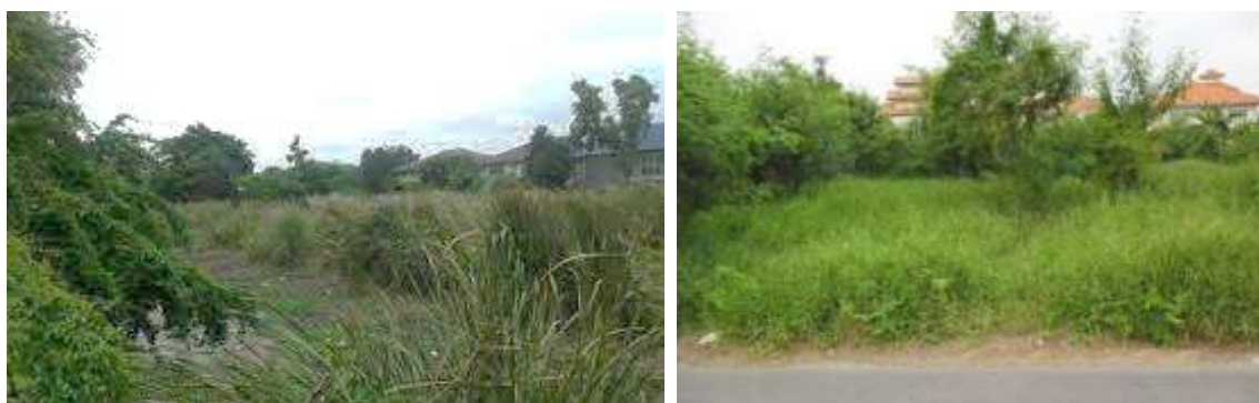
ที่ดินที่ทิ้งไว้ว่างเปล่าหรือไม่ได้ทำประโยชน์ตามควรแก่สภาพ